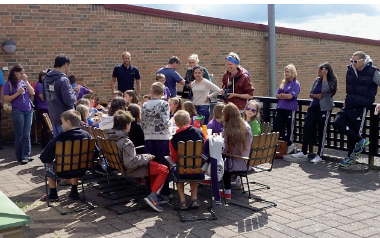
De vitrysska barnen är på sitt årliga studiebesök på Kungälv's brandstation med traditionsenlig korvgrillning.

Förbundet har även 2015 varit i arbete med att nå ut till ungdomar för att skapa en god relation samt verka proaktivt i hopp om att detta skall resultera i minskade antal olyckor.