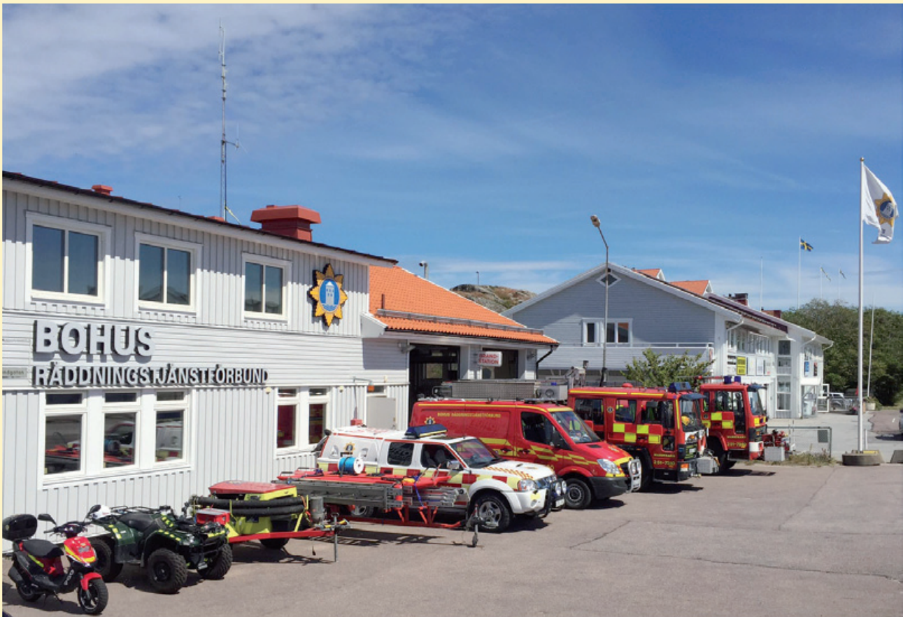
Marstrands brandstation (Köön)