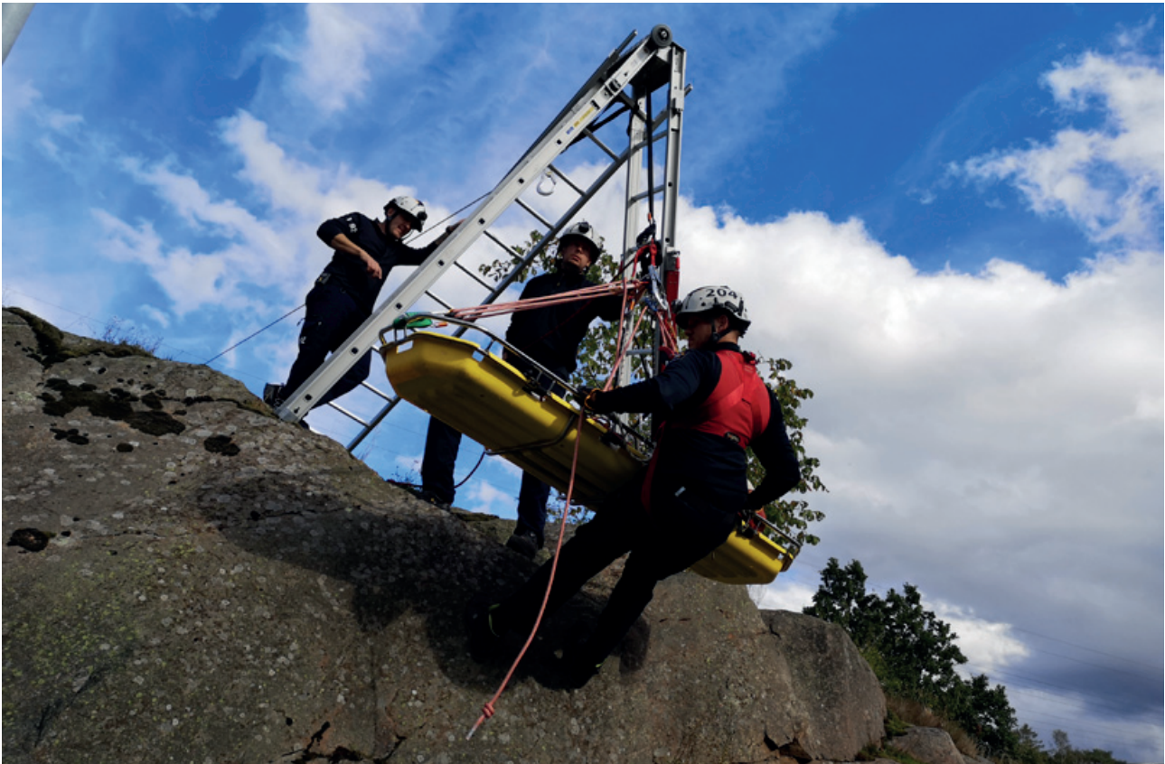
Övning räddning av person i svår belägenhet.

Pandemin har även medfört att Myndigheten för samhällsskydd och beredskap riktade om sina kursplaner till att bli digitala för att kunna genomföra teoretisk utbildning på distans, praktiska moment har inte kunnat genomföras. Detta har medfört att förbundet inte kunde få samtliga brandmän grundutbildade under hösten.