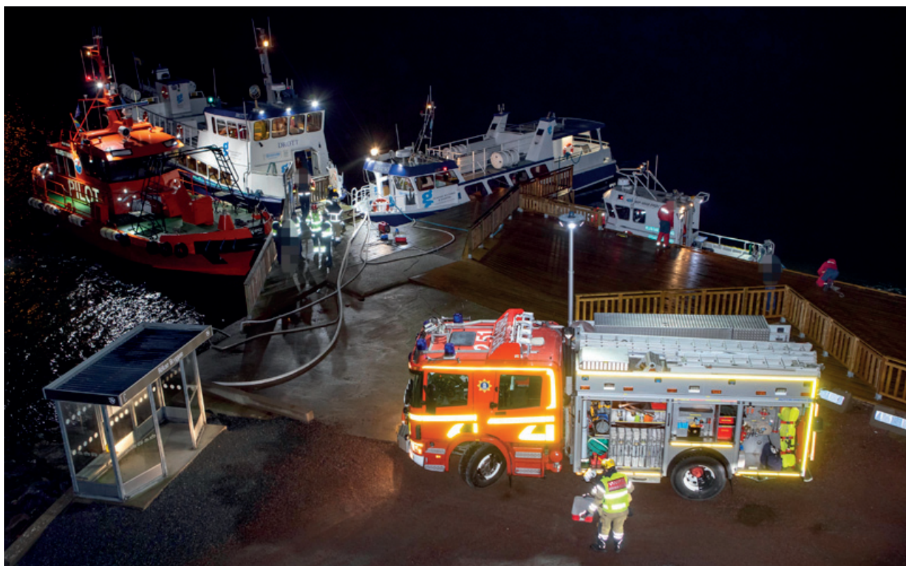
Samverkan mellan Lots, Räddningstjänst och Kustbevakning.