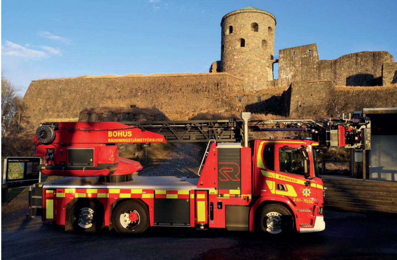
Nytt höjdfordon som levererades under 2020.